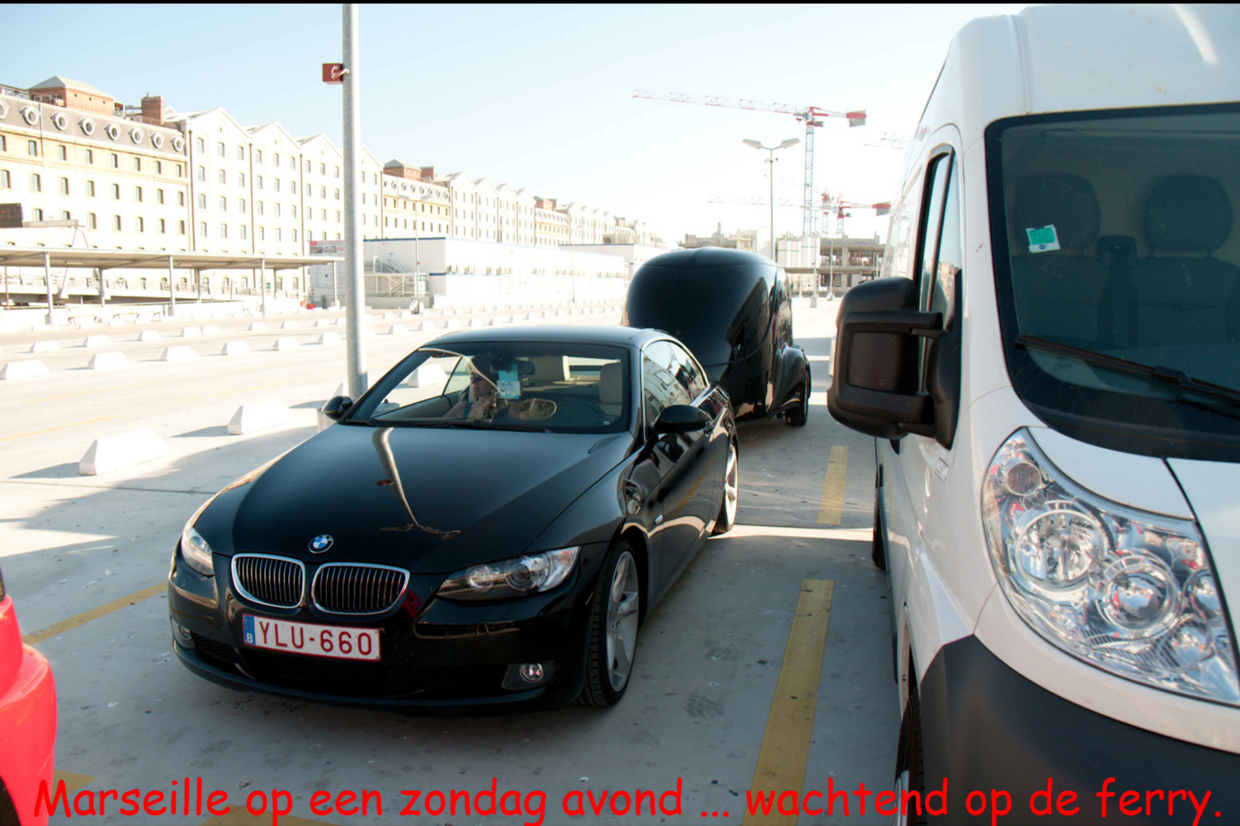
Marseille op een zondag avond ... wachtend op de ferry.