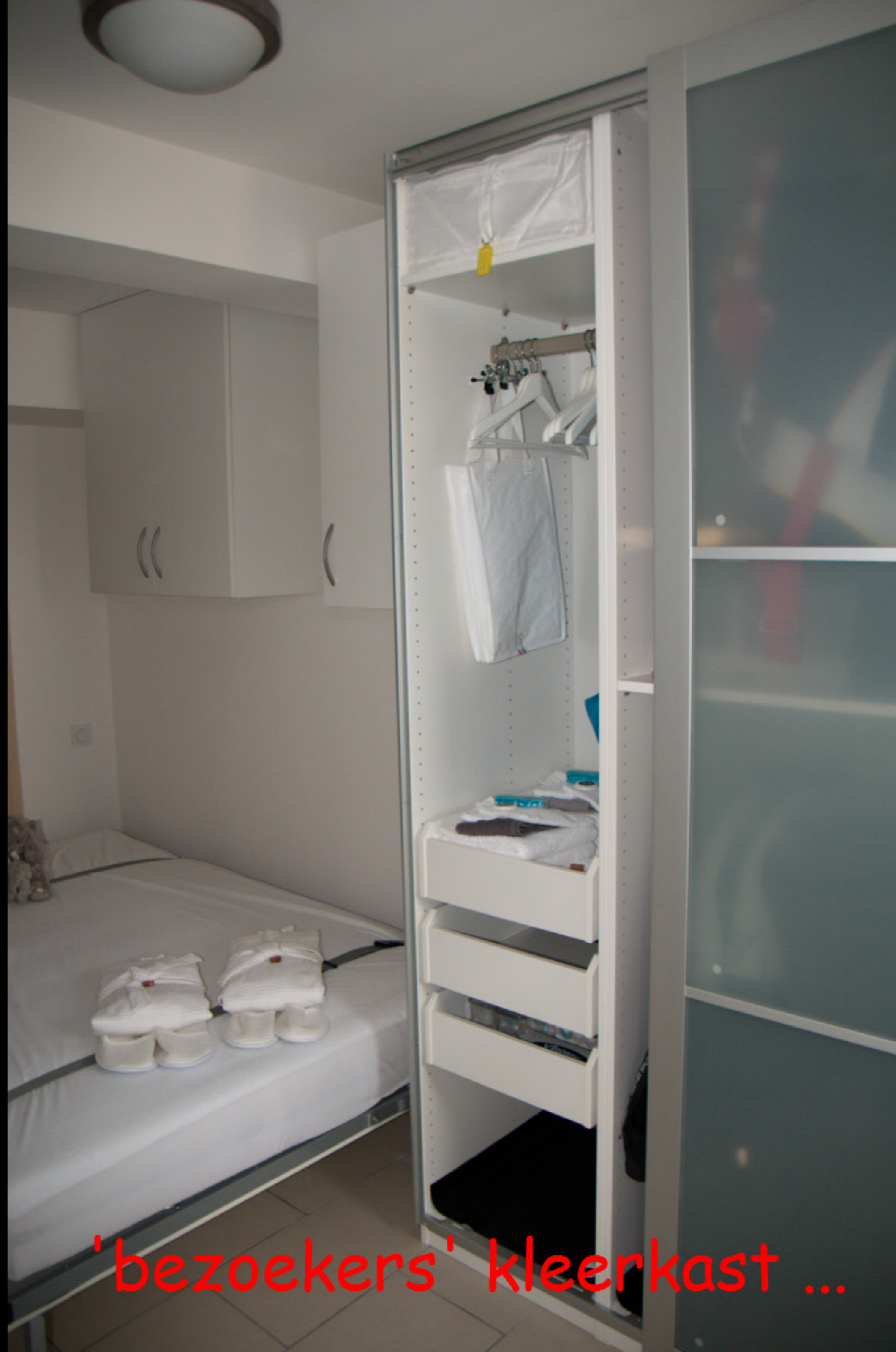
'bezoekers' klerkast ...