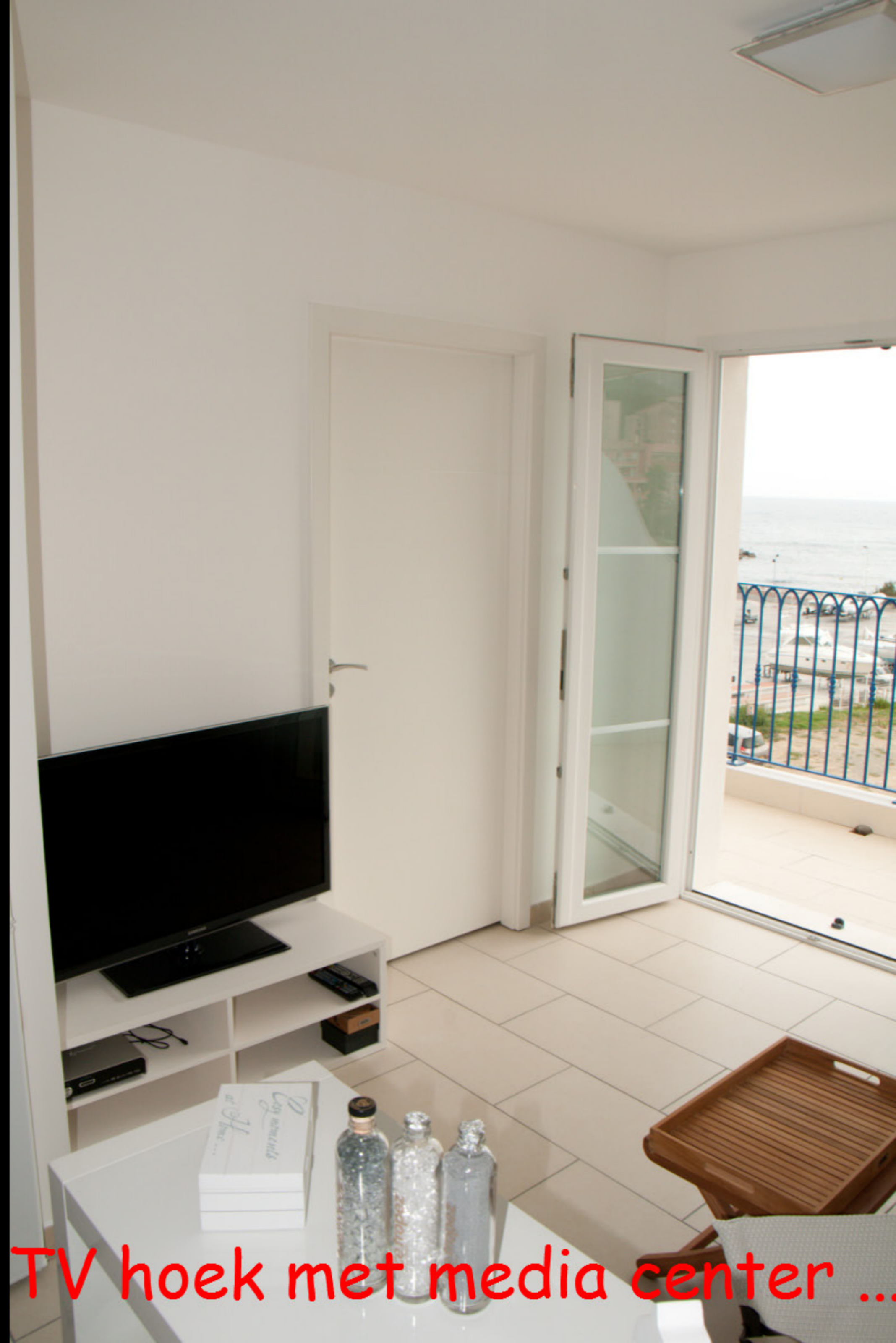
TV hoek met media center ...